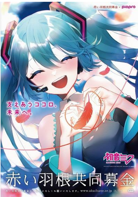
Art by nio © CFM

那賀町で集められた募金は、一旦全額徳島県共同募金会へ納入されます。『赤い羽根共同募金』は、そのうちの55%が「地域配分金」として那賀町共同募金委員会へと配分され、共同募金配分金事業費として地域に応じた多彩な福祉活動に使われます。各地区ごとに用途が異なりますが、いずれの場合も地域へ還元できるよう、工夫して事業を行っています。『歳末たすけあい募金』は、募金額の全額が那賀町共同募金委員会へと配分され、町内の歳末たすけあい事業に使われます。